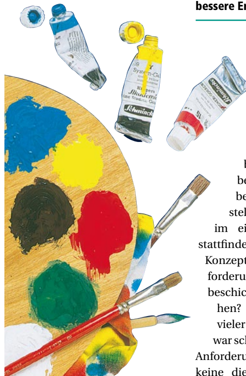
Aufgrund der größer werdenden Produktpalette musste die Herstellung flexibler werden.