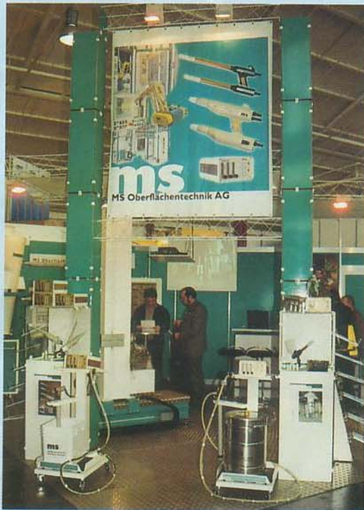
Bild oben links: Innovative Steuerungskonzepte für die Pulverbeschichtung bildeten einen Ausstellungsschwerpunkt am Stand von MS Oberflächentechnik.